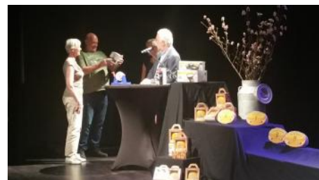
Piet van Eerden